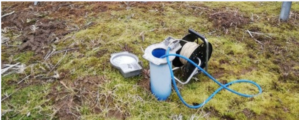
Tvarkingai įrengtas gręžinys