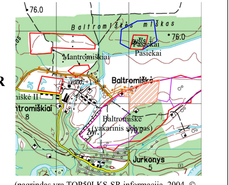
(pagrindas yra TOP50LKS-SR informacija, 2004. © Nacionalinė žemės tarnyba prie Žemės ūkio ministerijos)