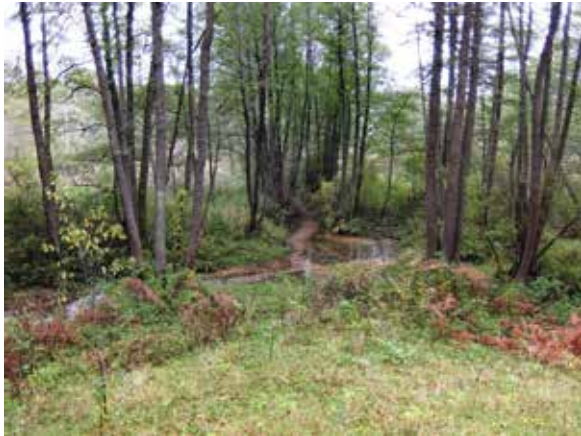
Versmių vanduo skuba į Ūlą

Čia supustyti smėlynai (130–145 m NN) pakimba ties pačia viršutine dabartinio slėnio briauna, o kai kur nustumę net žemyn vietomis susidariusiais stabiliais šlaitais. Sprendžiant iš grėž. 15930 (Zervynos) geologinio pjūvio perpustytos smilties ir suplauto smėlingo ir žvyringo sluoksnių (vIII–IV, fIIInm 3 ) bendras storis čia siekia 34 m, o pirmasis daugmaž vandensparinis arba mažai laidus rišlaus priesmėlio, priemolio sluoksnis (gIIInm 3 ) slūgso tik giliau 105 m NN altitudės. Ūlos pavagyje pirmasis gruntinį (vIII–IV, fIIInm 3 sluoksniai) ir spūdinį tarpmoreninį (fIIImd sluoksnis) vandenį izoliuojantis arba atskiriantis Grūdos (gIIIgr) pagrindinės morenos sluoksnis labai priartėjęs prie dabartinio slėnio dugno ir užklotas tik apie 5 m storio įvairaus rupumo smėliu (aIV, fIIInm 3 ).