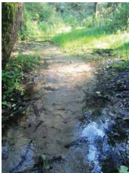
Stelmokiškės šaltinis liejasi šlaito papėdėje

Prie Ūlos, bene gražiausios ir veržlios Dainavos krašto girių upės, sutūpę senoviniai Kašėtų, Pauosupės, Zervynų, Mančiagirės, Žiūrų, Trakiškių, Paūlių kaimai ir kaimeliai. Juose ir dabar išlikusios sodybos gražiai tvarkomos, upės krantai prižiūrimi. Vienas iš išpūdingesnių parke ir dabar išlieka gatvinis 42 sodybų Zervynų kaimas. Tai unikalio miškų ūkio kaimavietė, iki šiol išlaikiusi XVIII–XIX a. susiformavusį planą ir liaudies architektūros savitumus ir išmonę, išraiškingus mažosios architektūros elementus – kryžius, pagal seną tradiciją papuošiamus mergiškomis prijuostėmis. Jos ant kryžių rišamos vestuvių papročiu, kad susilauktų vaikų, taip pat rištos ir kad „smailesnės“ dukros nesantuokinio vaiko glėby neparsineštų. Negalima įsivaizduoti pačių Zervynų be girių smėlynuose klajojan-