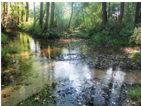
Stelmokiškės – čia susilieja trys šaltiniai

Kaip ir dauguma šio krašto versmių Stelmokiškės šaltinis yra krentantis, maitinamas